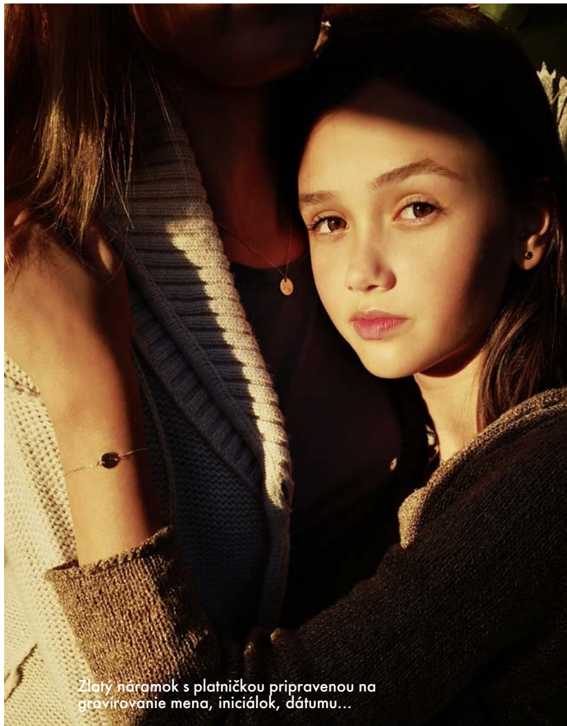
Zlatý náramok s platničkou pripravenou na gravírovanie mena, iniciálok, dátumu...