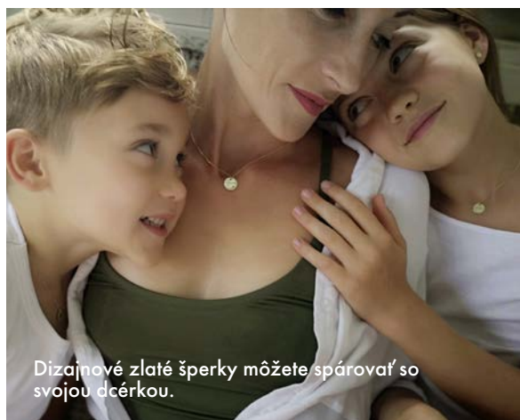
Dizajnové zlaté šperky môžete spárovať so svojou dcérou.