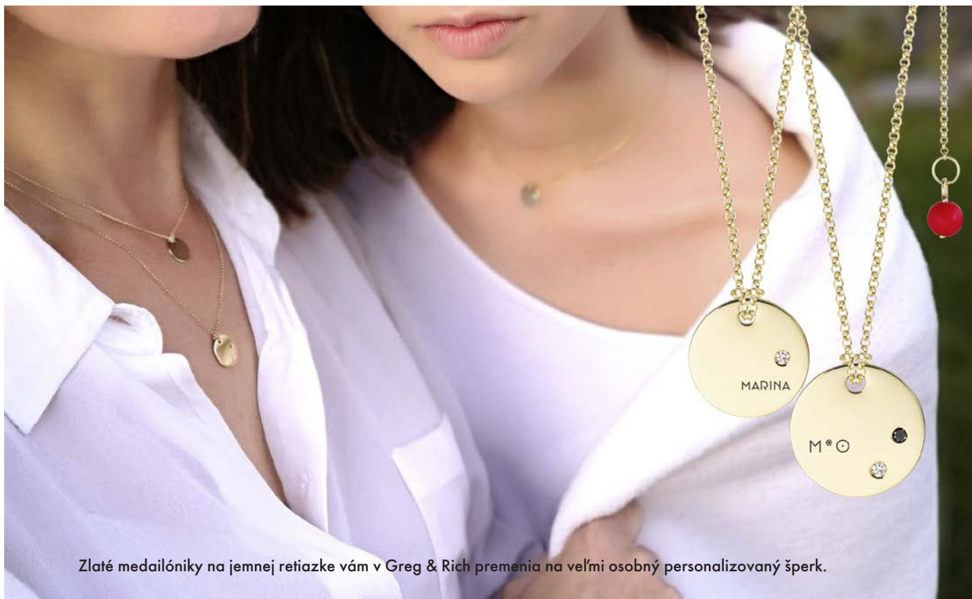
Zlaté medailóniky na jemnej retiazke vám v Greg & Rich premenia na veľmi osobný personalizovaný šperk.